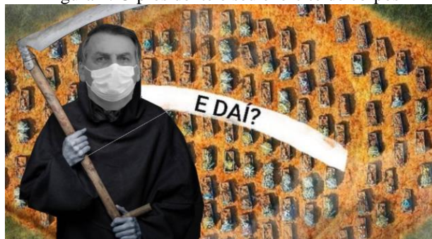
Figura 1: O presidente e seu exército de corpos