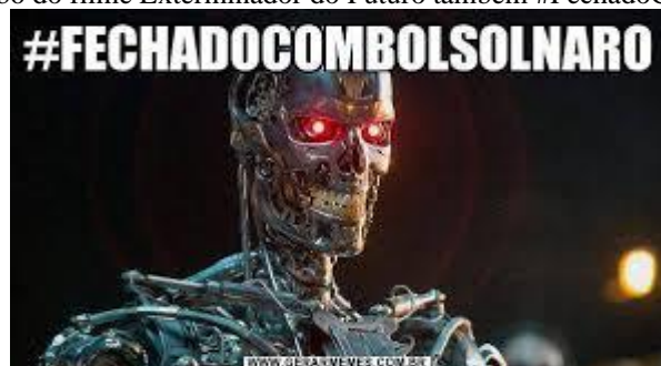
Figura 3: Robô do filme Exterminador do Futuro também #FechadoComBolsolnaro