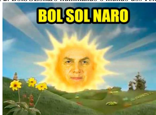
Figura 2: BolSOLonaro iluminando o mundo dos Teletubbies