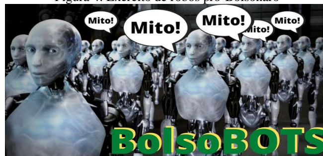
Figura 4: Exército de robôs pró-Bolsonaro