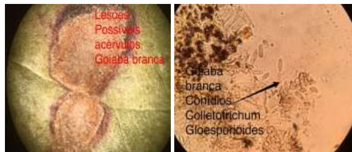
Figura 2. Lesões com conídios de Colletotrichum sp. em Psidium guajava .

de coloração palha a esbranquiçado, observando-se sinais do patógeno na forma de fascículos de conidióforos.