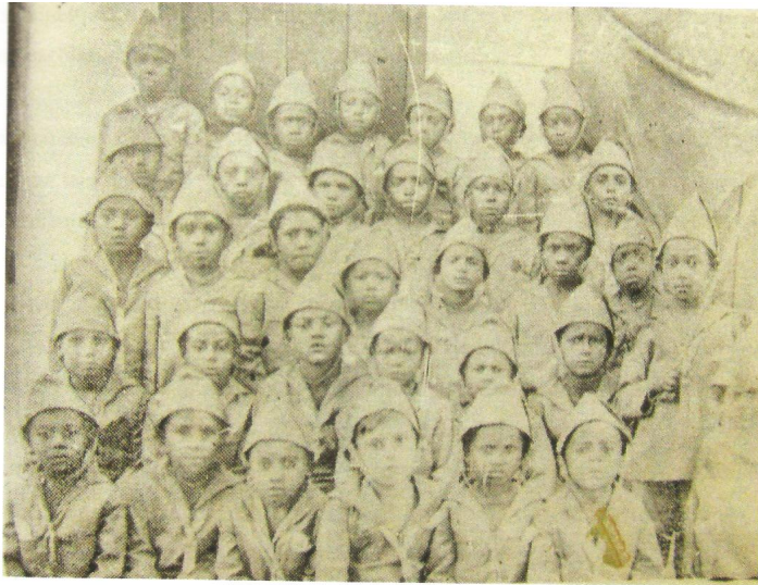
Figura 02 - Alunos da escola estadual de São José da Motta/ Bahia (TEIXEIRA, 1928, p. 50).