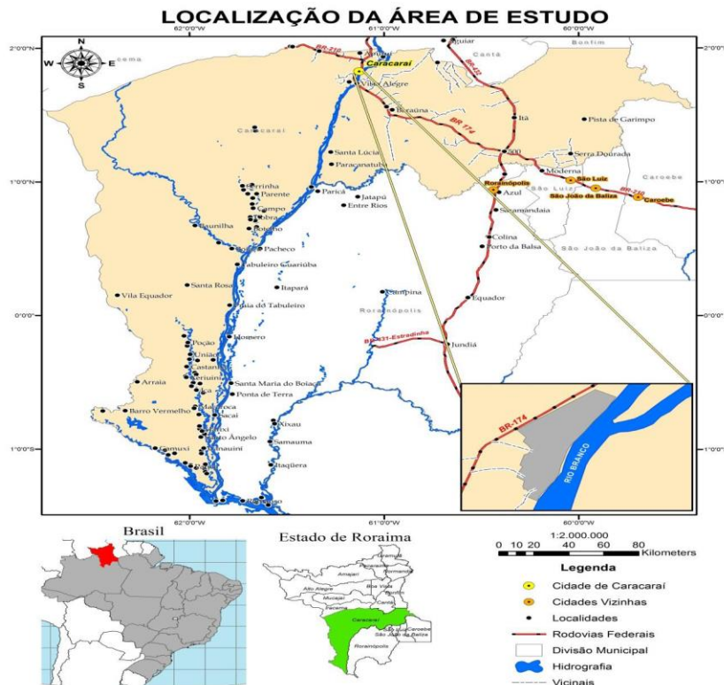
Figura 1: Localização da área de estudo – Município de Caracarái.

A cidade de Caracarái tem sua estrutura muito bem organizada fisicamente, em se tratando de tecido urbano, no entanto vem passando por transformações no seu contexto socioespacial. O trabalho de campo e a análise documental e bibliográfica ampliaram o conhecimento a respeito dos fatores de produção e reprodução desses espaços.