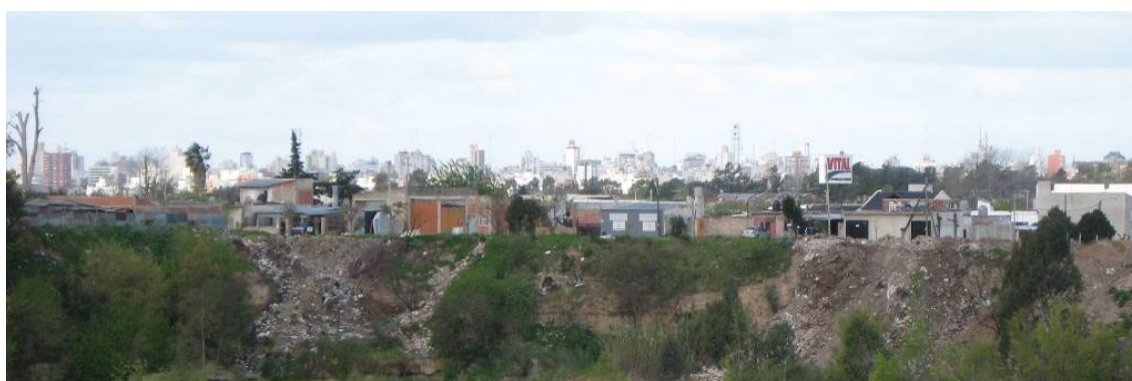
Imagen 1. Periurbano de la Ciudad de La Plata. Asentamiento sobre borde de cava.