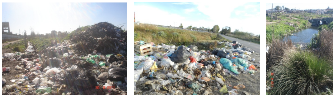
Imagen 2. Contaminación por residuos sólidos.

inundables y contaminación de los suelos, lo cual se puede ver en las siguientes imágenes.