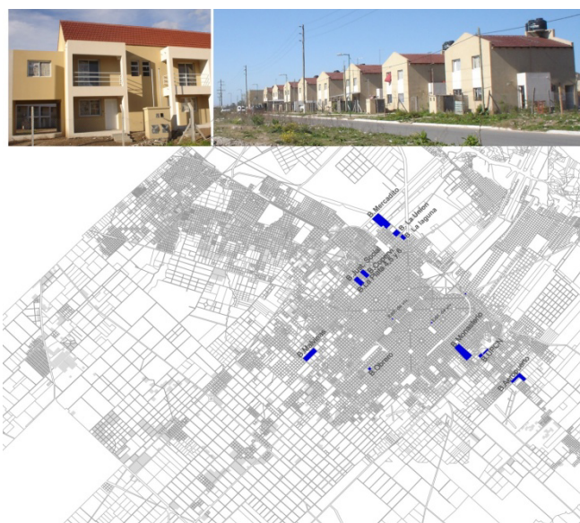
Fig. 2. Localización de Planes de vivienda en La Plata.

la construcción del Plan federal de viviendas en el Barrio el Mercadito. La mayoría de los planes de vivienda están localizados en la periferia de la ciudad.